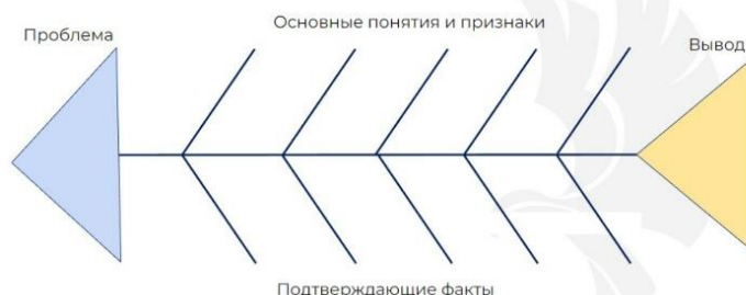
Рисунок 2. - Фишбоун

Хвост – ответ на поставленный вопрос, выводы, обобщения (Рисунок 2).