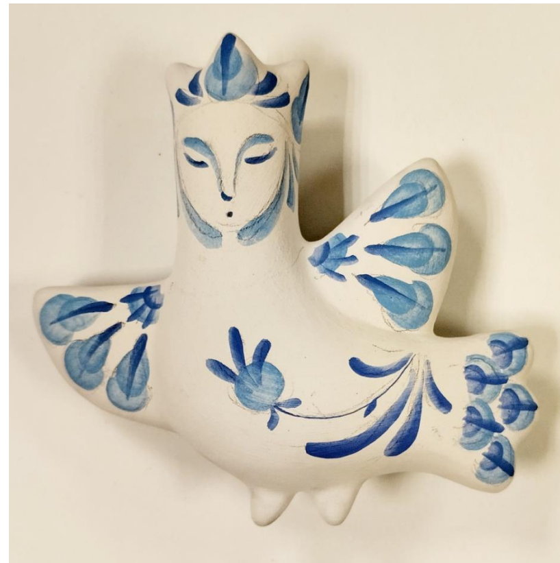
Рисунок 11. Готовая роспись