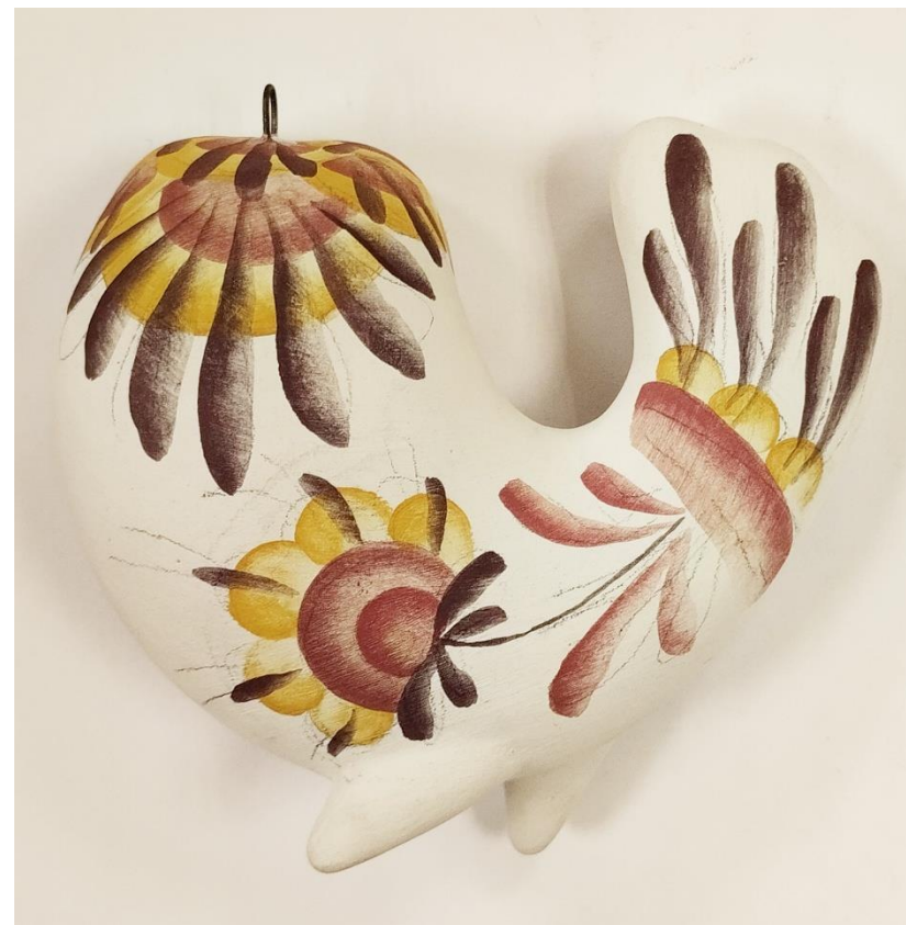
Рисунок 14. Вариант росписи