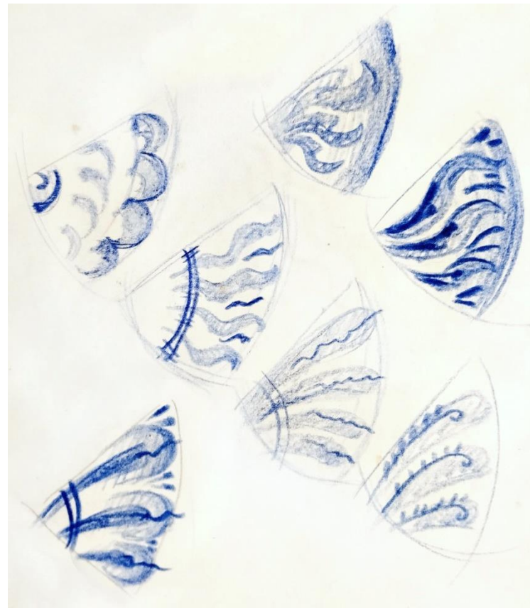
Рисунок 4. Графические эскизы