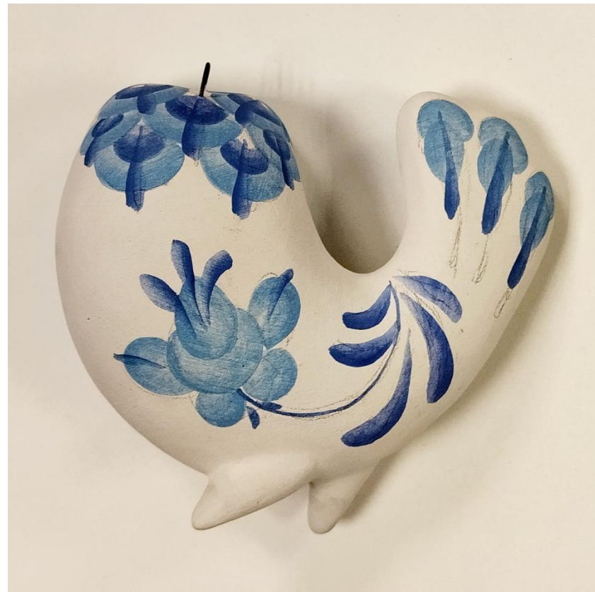
Рисунок 12. Готовая роспись