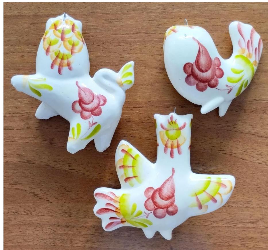
Рисунок 20. Готовые фигурки