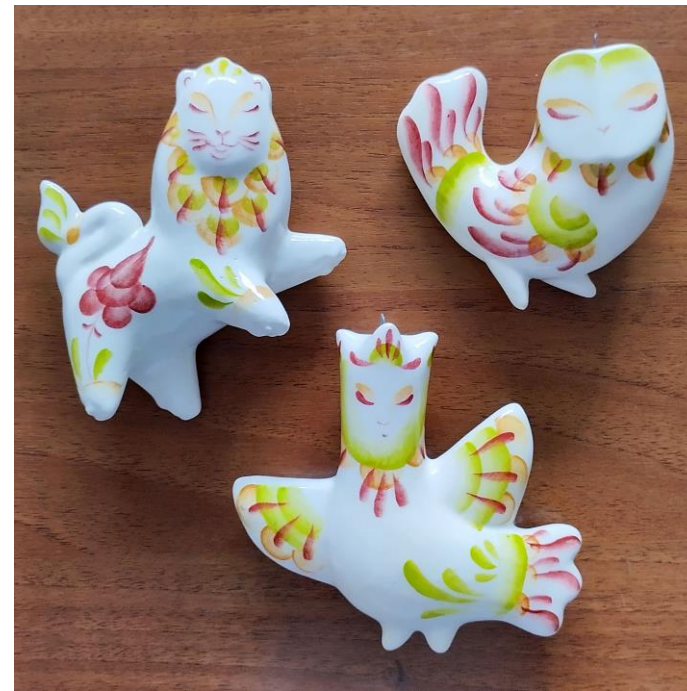
Рисунок 1. Варианты елочных игрушек