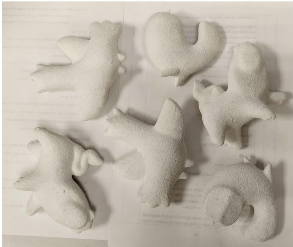
Рисунок 16. Покрытие глазурью методом пульверизации