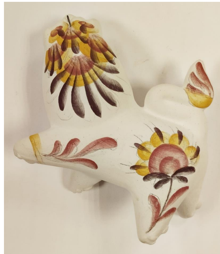
Рисунок 15. Вариант росписи