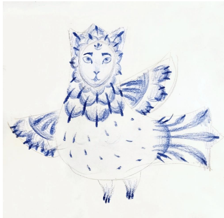
Рисунок 2. Графические эскизы