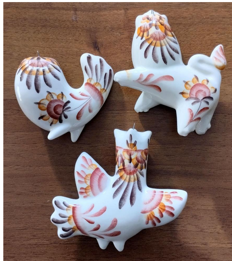
Рисунок 19. Готовые фигурки