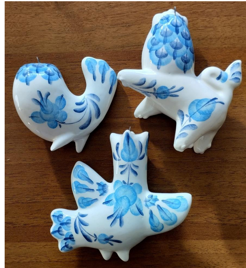
Рисунок 18. Готовые фигурки