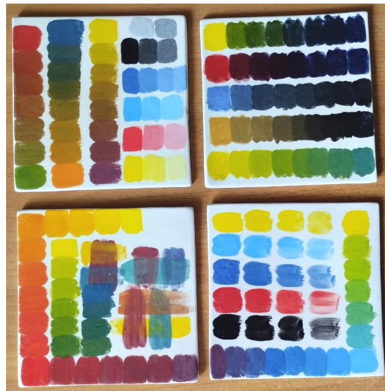
Рисунок 8. Цветовые пробники подглазурных красок