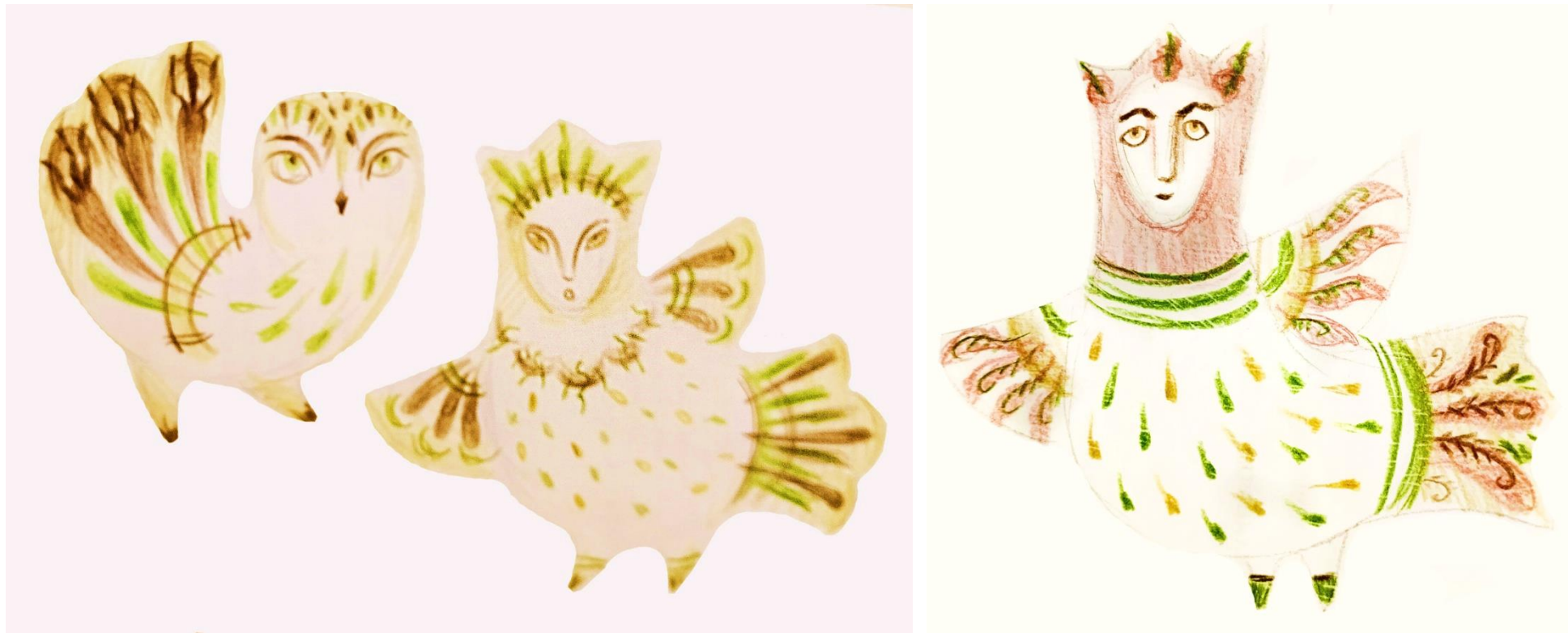
Рисунок 5. Графические эскизы