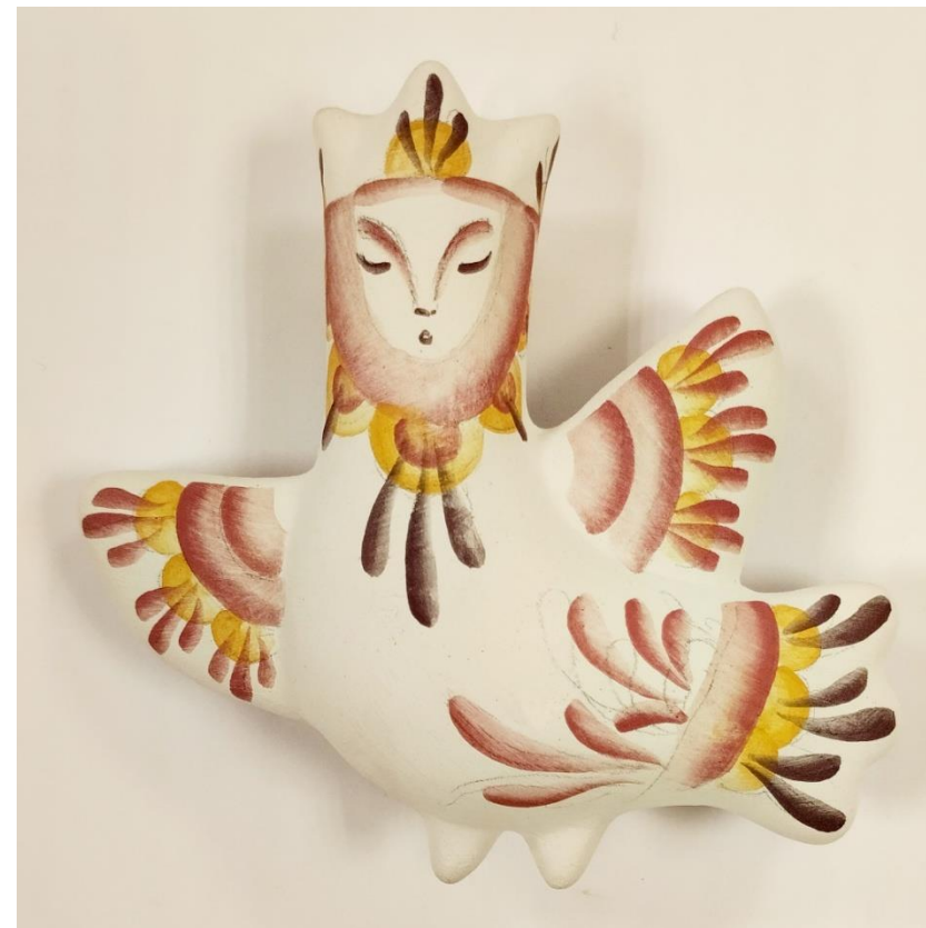
Рисунок 13. Вариант росписи