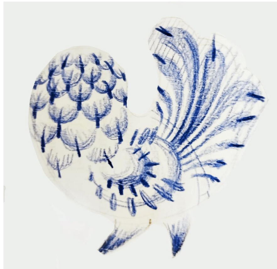
Рисунок 3. Графические эскизы