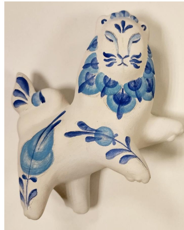
Рисунок 10. Последовательность росписи