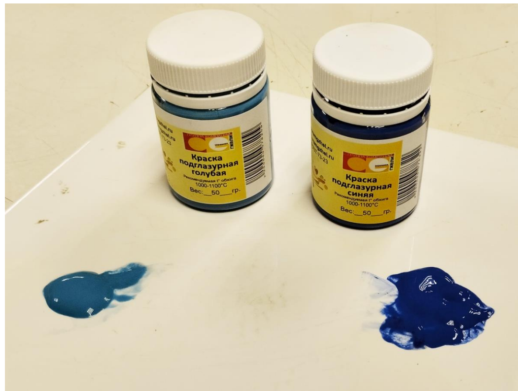
Рисунок 7. Подглазурные краски производства Гжели