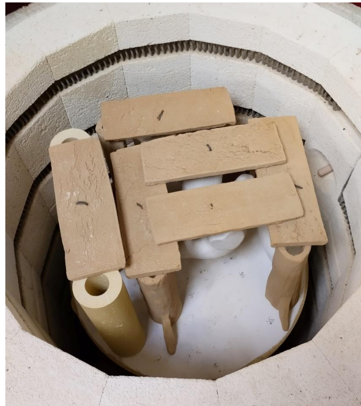
Рисунок 17. Установка на обжиг