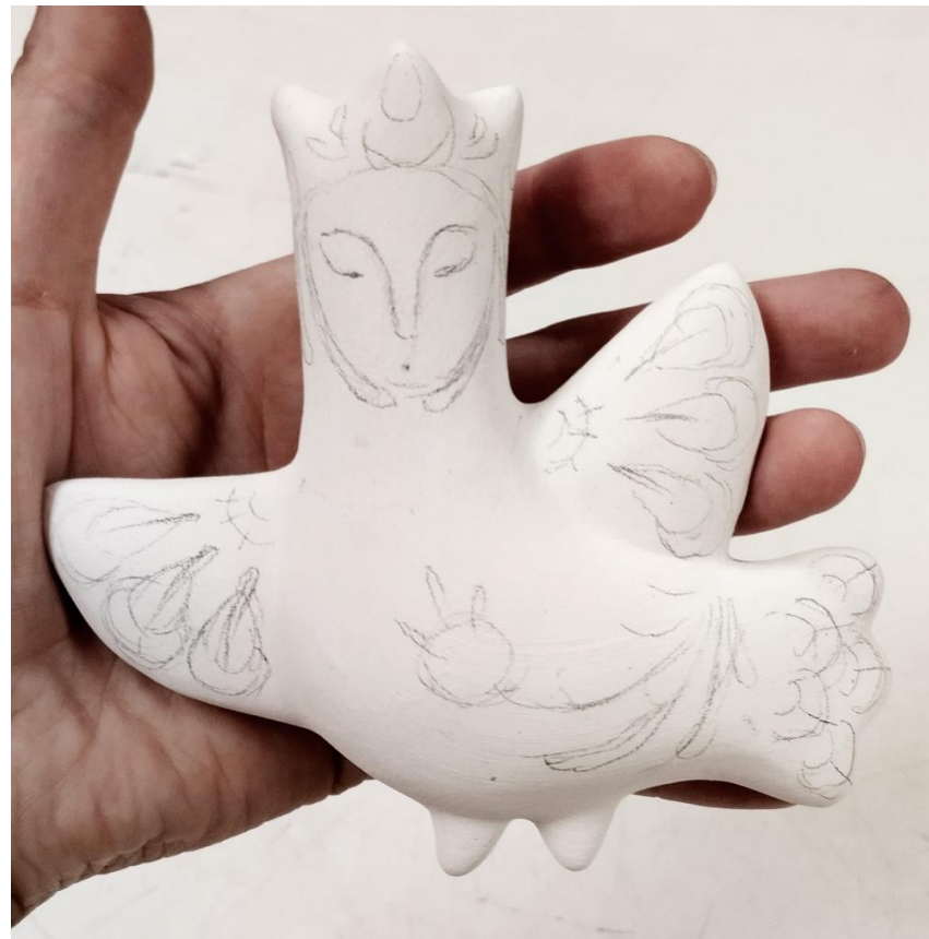
Рисунок 9. Перенос рисунка на фигурку