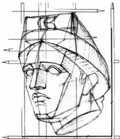
Конструктивное построение головой