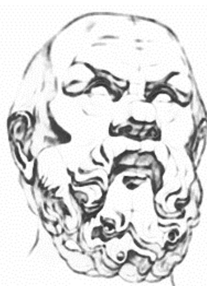
Линейное и светотеневое построение формы