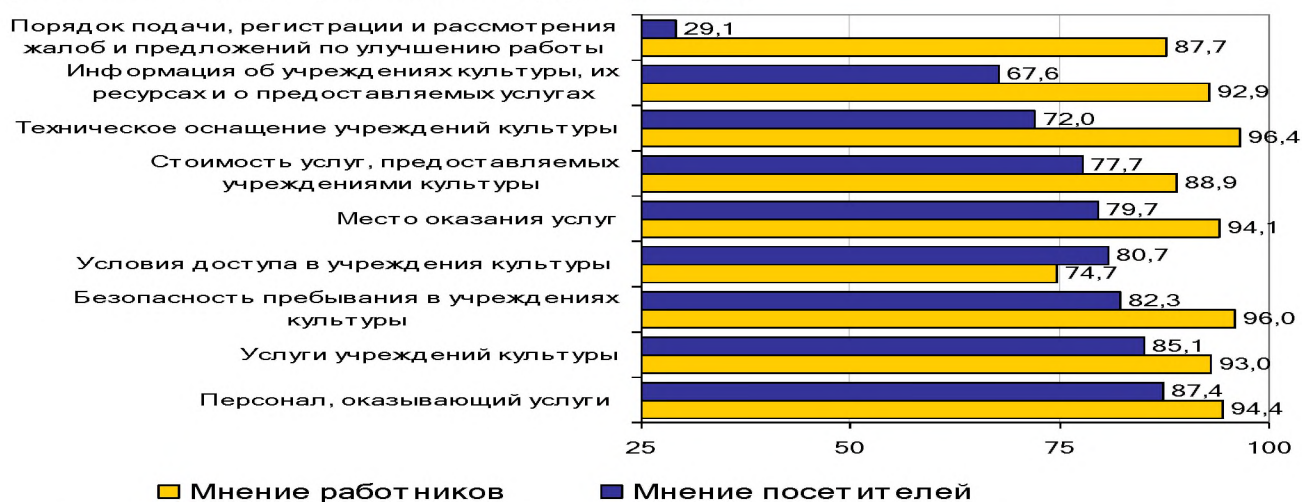
Рис. Оценка уровня качества предоставления услуг организациями сферы культуры по мнению работников и посетителей

2. Разработайте план мероприятий повышения уровня качества предоставления услуг (не менее пяти мероприятий по каждому критерию оценки уровня качества предоставления услуг организациями сферы культуры)